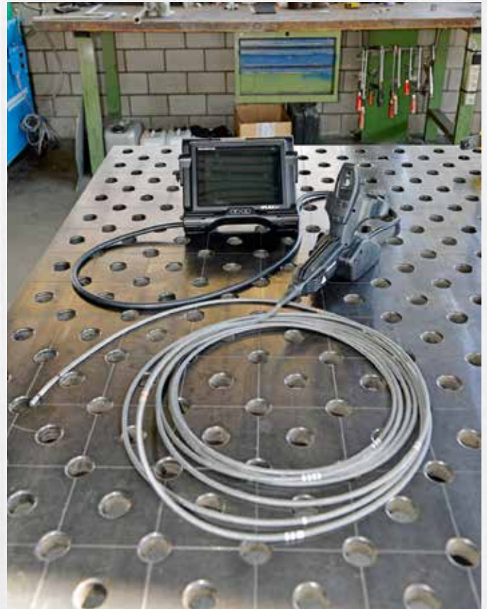
Video-Endoskop mit flexiblen 7 m langen Sonden für Schweißnaht-Kontrollen oder Fehleranalysen im Rohrleitungssystem und Anlagen.