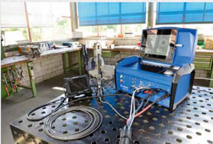
Zwei Orbitalgeräte zum Schweißen in der Pharma- und vermehrt auch in der Lebensmittelindustrie stehen bei uns im Einsatz.