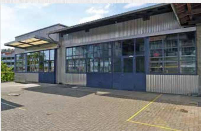
Unser neuer Standort an der Mühlestrasse in Laupen. 220 m 2 Werkstatt und Montagehalle für Vormontagen von Anlagen und Modulen stehen uns zur Verfügung.