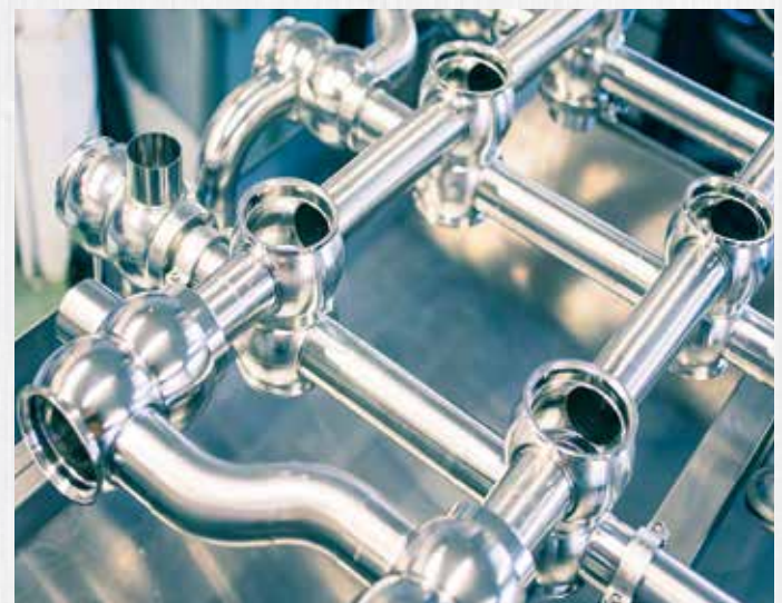
Ventilknoten für die Lebensmittelindustrie. Alle Rohrverbindungen orbitalgeschweisst und mit dem Endoskop kontrolliert.