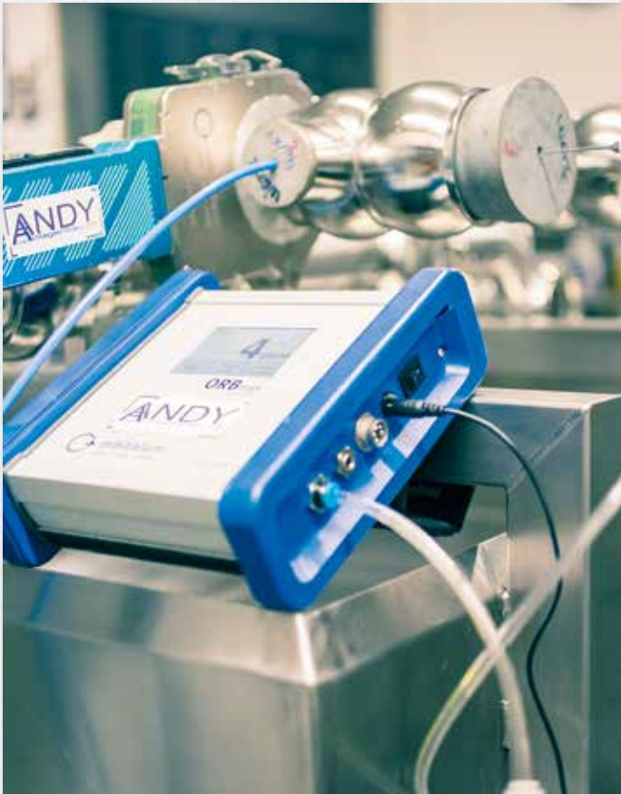
Restsauerstoff-Kontrollgerät ist unverzichtbar für eine qualitative Wurzelschweißung.