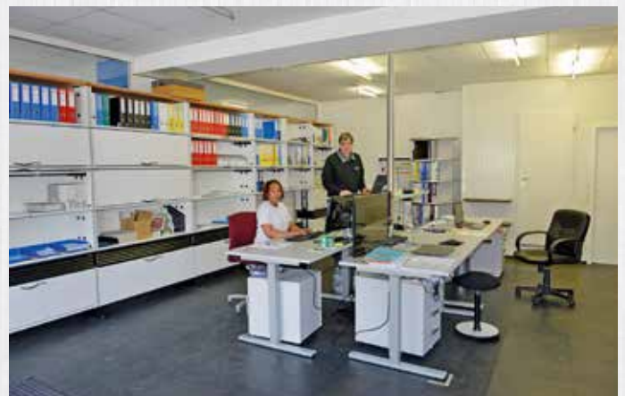
Im neuen und hellen Büro gibt es auch mehr Platz für Kreativität.