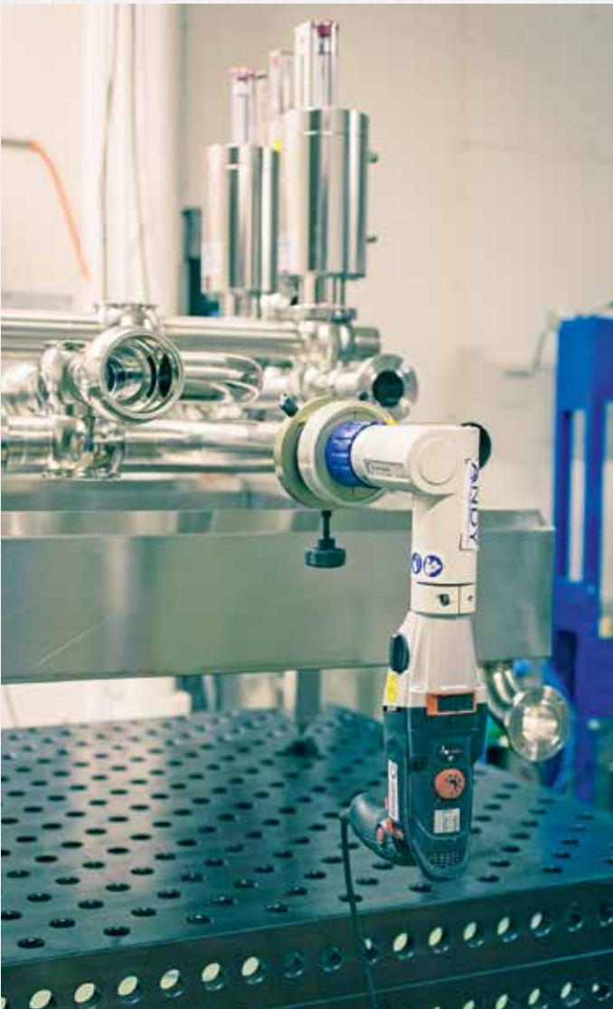
Rohrendenbearbeitungsmaschine für optimale Schweißnahtvorbereitung.