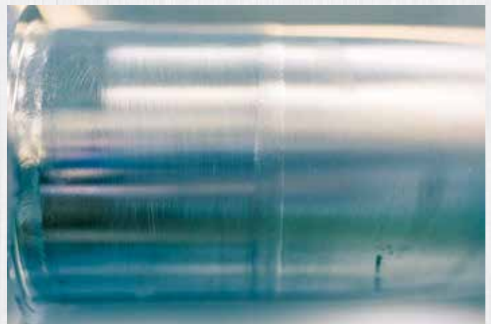
Schweißnaht Aussenansicht Orbitalgeschweisst mit geschlossener Schweißzange.